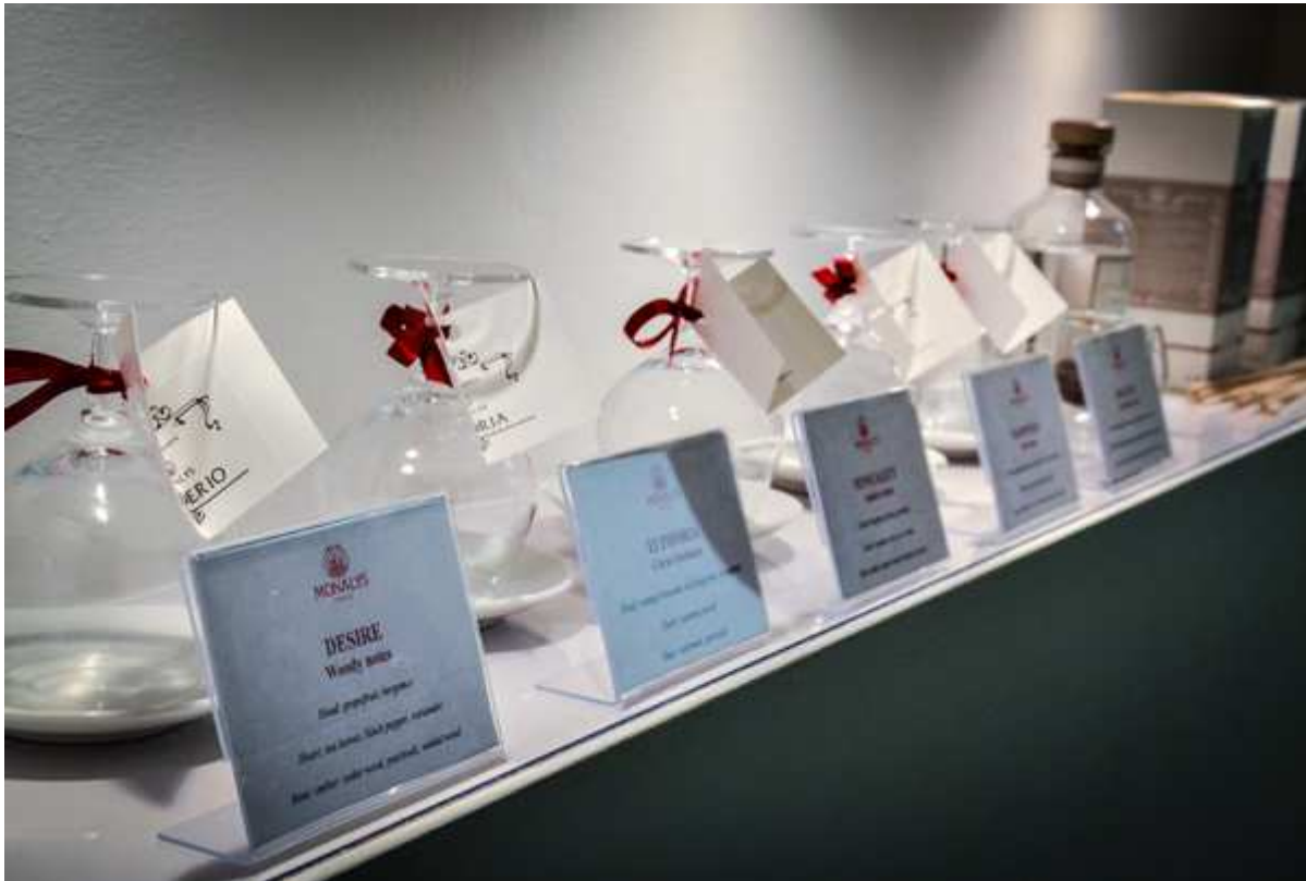
( http://www.2fashionsisters.com/profumeria-monalys-cosmesi-su-misura/antica-profumeria-monalys-firenze-2-fashion-sisters/ )