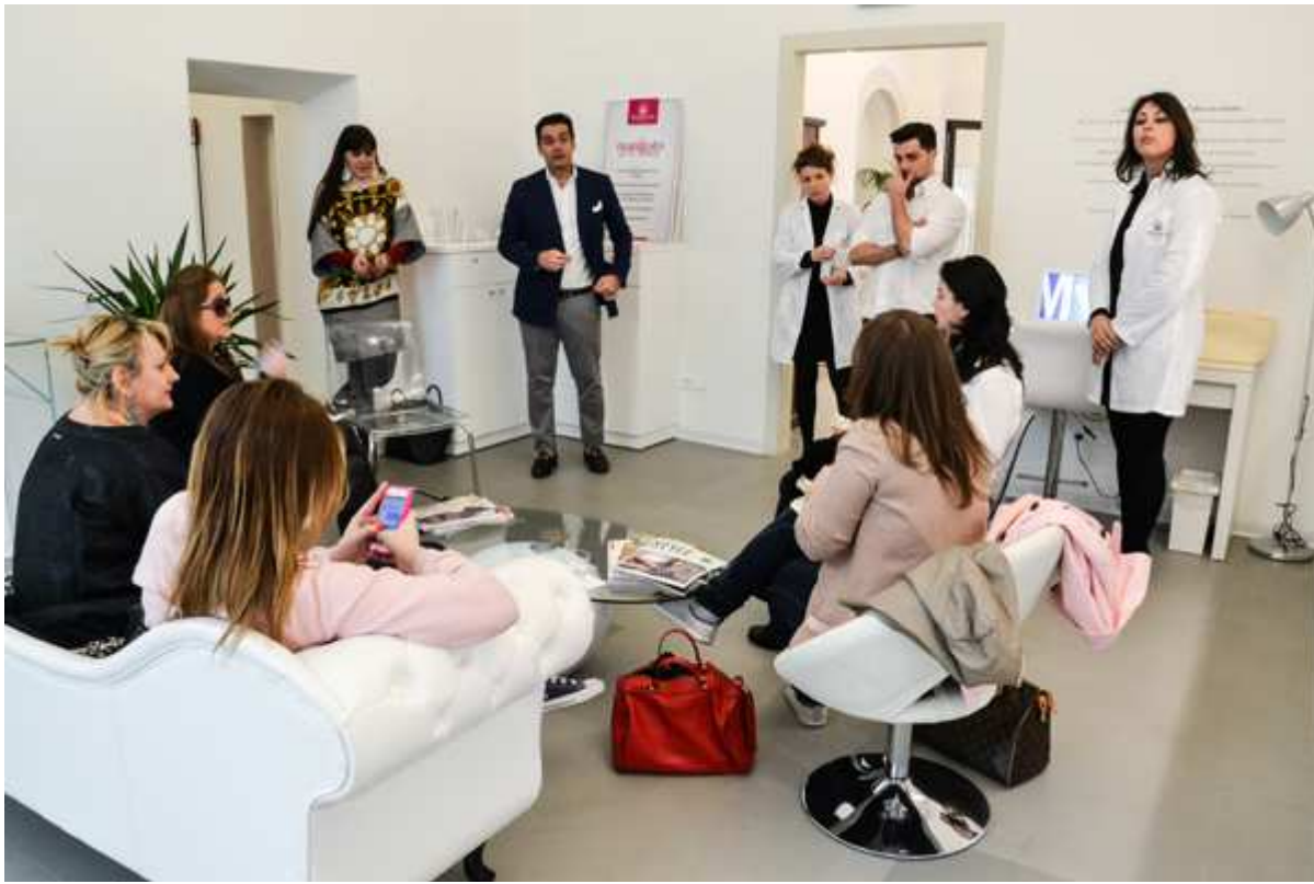
( http://www.2fashionsisters.com/profumeria-monalys-cosmesi-su-misura/monalys-fashion-blogger-italia-2-fashion-sisters/ )