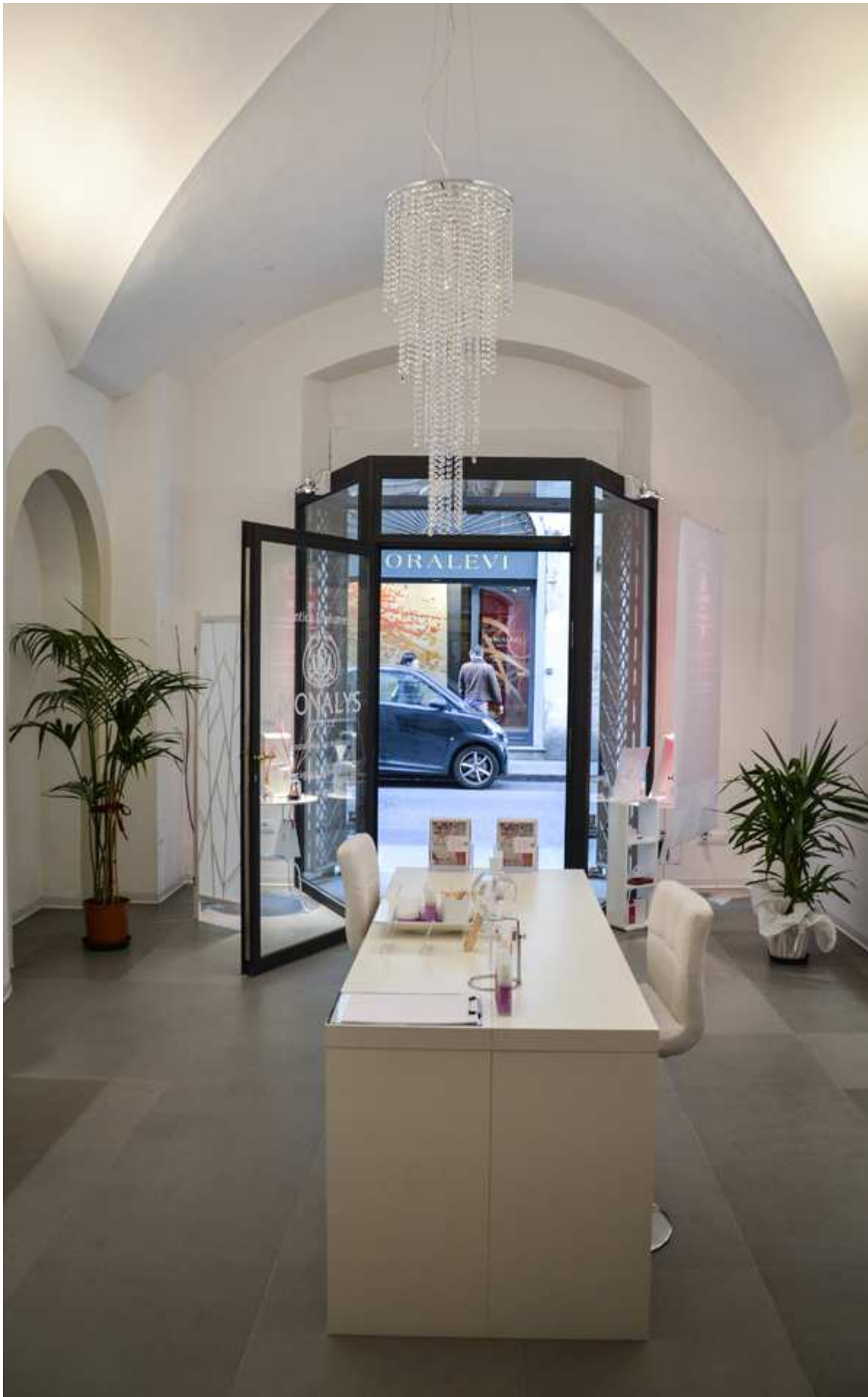
( http://www.2fashionsisters.com/profumeria-monalys-cosmesi-su-misura/beauty-monalys-firenze/ )